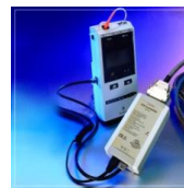
Digital a convertidor analógico (sleep Labs) cs07143