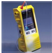
Funda protectora cs07779