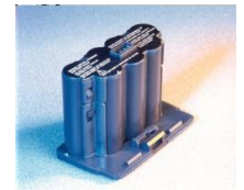
Cargador batería Cs03775 Pack batería Cs03736