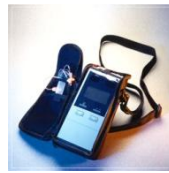
Bolsa transparente cs04321