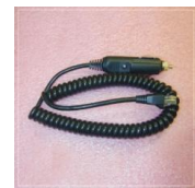
Cable de 12v cs08505