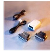
Kit adaptador Comunicaciones cs04284