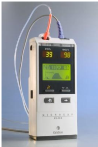
Microcap® Plus CS08507

Microcap Plus, motorización continua de CO 2 y SPO 2 (con tecnología Nellcor Oximax™)